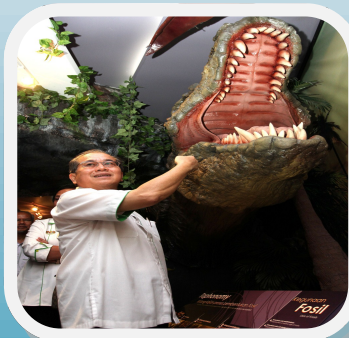
Perasmian Muzium Geologi Perak Hal 6