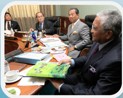
Majlis Tanah Negara ke 67 hal 3