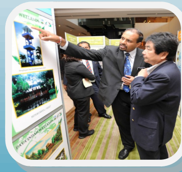
Seminar My Bio-D 2011 Hal 8