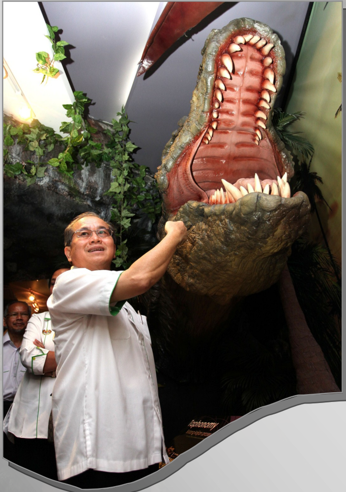
GURAU... YB Menteri bergurau dengan semua yang hadir ketika dalam sesi lawatan beliau didalam Muzium Geologi.

Ipoh, 1 Nov – YB Dato Sri Douglas Uggah Embas, Menteri Sumber Asli dan Alam Sekitar telah menyempurnakan perasmian Muzium Geologi yang bertempat di Kompleks Geologi Jabatan Mineral dan Geosains, Ipoh, Perak. Muzium ini dilengkapi kemudahan interaktif yang dinaikkan taraf dengan peruntukan RM1.3 juta.