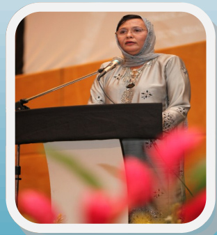
Malam Apresiasi NRE Hal 9